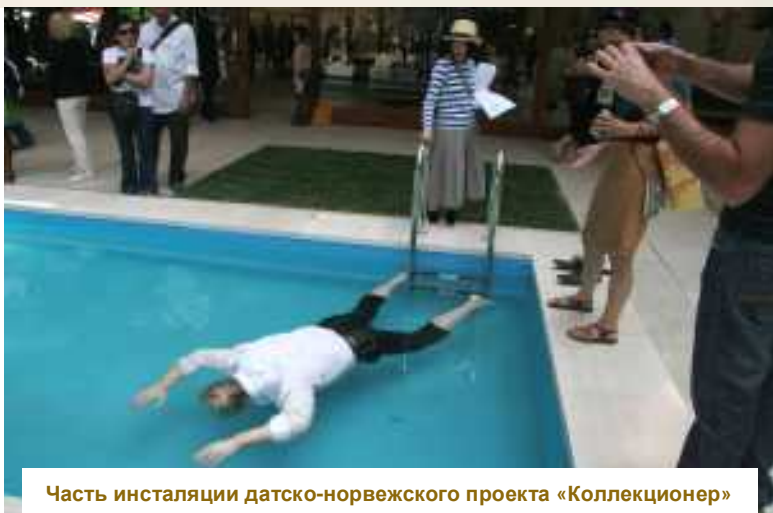
Часть инсталляции датско-норвежского проекта «Коллекционер»

Подводя итог своему небольшому обзору национальных павильонов в Венеции, отмечу, что из стран СНГ, кроме России свои национальные павильоны представили Азербайджан, Армения, Грузия и Украина.