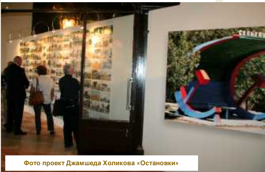
Фото проект Джамшеда Холикова «Остановки»

новременно мистический образ – лишенный идентичности и вызывающий одновременно ассоциации с распространенными клеше из «западной» и «восточной» традиций – гламурный спа-салон для ценителей всего натурального или традиционная молочная ванна восточной царицы. На выставке перформанс представлен шестью фотографиями и видео.