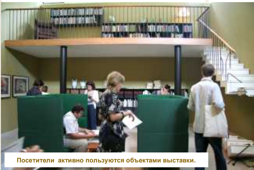
Посетители активно пользуются объектами выставки.

давно таковым не является. Наоборот, современное визуальное искусство стремится избавиться от изображения жизни, ее искусственного воспроизведения, пытаясь быть как можно более естественным, интегрированным в жизнь, а не противопоставляемым ей.