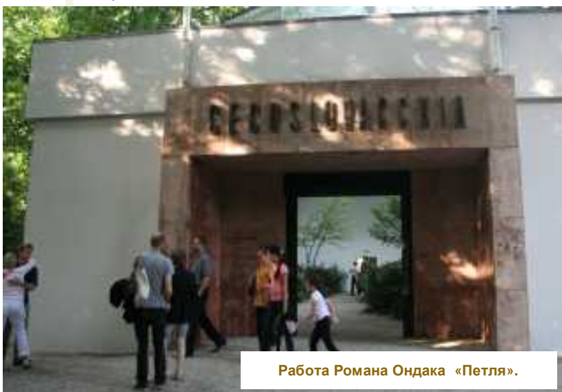
Работа Романа Ондака «Петля».