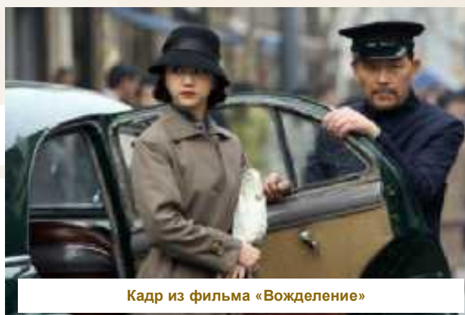
Кадр из фильма «Вождение»

Кажется, Анг Ли хотел передать, что главная сила, суть фильма — в названии. «Вождение» — это ведь единственное слово, передающее желание, поглощающее желание другого человека — и, что принципиально, это эгоистичное желание. И вот на этом то эгоизме двух главных героев и построена вся картина — а следить за двумя сильными, изящными и крепкими личностями, когда вот-вот они будут зависеть друг от друга — это потрясающее удовольствие.