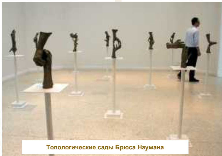
Топологические сады Брюса Наумана

нить определенную долю объективности, отмечу, что еще одно сходство Венецианской биеннале с олимпийскими играми заключается в ее соревновательном характере – на официальном открытии биеннале, в котором принимает участие президент Италии, происходит вручение призов – «Золотых львов» лучшему павильону и лучшему художнику. Также жюри может отметить лучшего молодого художника или лучшее кураторское решение того или иного проекта. Лучшим национальным павильоном на 53-ей Венецианской биеннале был признан павильон США, в котором была представлена ретроспективная выставка живого классика американского концептуализма 1960-х годов Брюса Наумана «Топологические сады» (Topological Gardens). Объектами художественного исследования Наумана являются искусство и художник, как его производитель. В его художественной практике особое значение имеет тело, а точнее его части – к примеру, руки, руки художника, на которых лежит основная нагрузка по «производству» искусства, не обходит он вниманием и голову. Как правило, из этой головы изливается вода – метафоричная интерпретация художника, делающего искусство – вроде как изливающего свою душу.