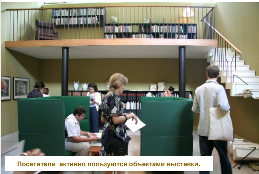
Посетители активно пользуются объектами выставки.

давно таковым не является. Наоборот, современное визуальное искусство стремится избавиться от изображения жизни, ее искусственного воспроизведения, пытаясь быть как можно более естественным, интегрированным в жизнь, а не противопоставляемым ей.