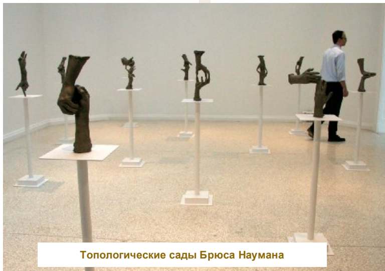
Топологические сады Брюса Наумана

нить определенную долю объективности, отмечу, что еще одно сходство Венецианской биеннале с олимпийскими играми заключается в ее соревновательном характере – на официальном открытии биеннале, в котором принимает участие президент Италии, происходит вручение призов – «Золотых львов» лучшему павильону и лучшему художнику. Также жюри может отметить лучшего молодого художника или лучшее кураторское решение того или иного проекта. Лучшим национальным павильоном на 53-ей Венецианской биеннале был признан павильон США, в котором была представлена ретроспективная выставка живого классика американского концептуализма 1960-х годов Брюса Наумана «Топологические сады» (Topological Gardens). Объектами художественного исследования Наумана являются искусство и художник, как его производитель. В его художественной практике особое значение имеет тело, а точнее его части – к примеру, руки, руки художника, на которых лежит основная нагрузка по «производству» искусства, не обходит он вниманием и голову. Как правило, из этой головы изливается вода – метафоричная интерпретация художника, делающего искусство – вроде как изливающего свою душу.