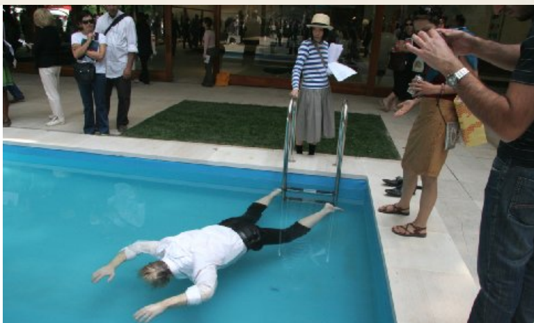
Часть инсталляции датско-норвежского проекта «Коллекционер»

Подводя итог своему небольшому обзору национальных павильонов в Венеции, отмечу, что из стран СНГ, кроме России свои национальные павильоны представили Азербайджан, Армения, Грузия и Украина.