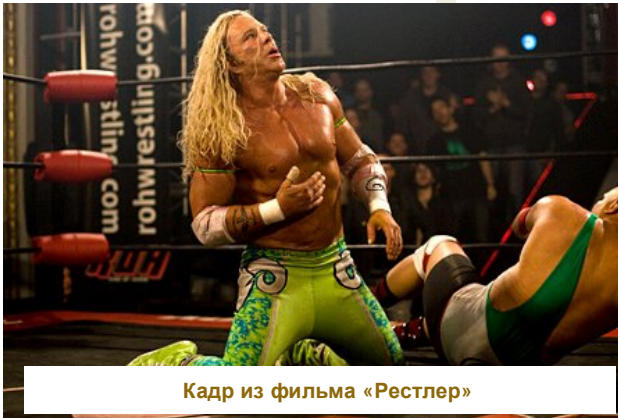
Кадр из фильма «Рестлер»

В кои-то веки гражданин Аронофски снял совершенно понятное кино — и каждый волен его понимать как ему больше нравится. А ведь такие прошлые легенды Даррена Аронофски как "Фонтан" и "Реквием по мечте" забыть сложно при всем желании, чему я и радуюсь. Микки Рурку поклон и благодарственные речи.