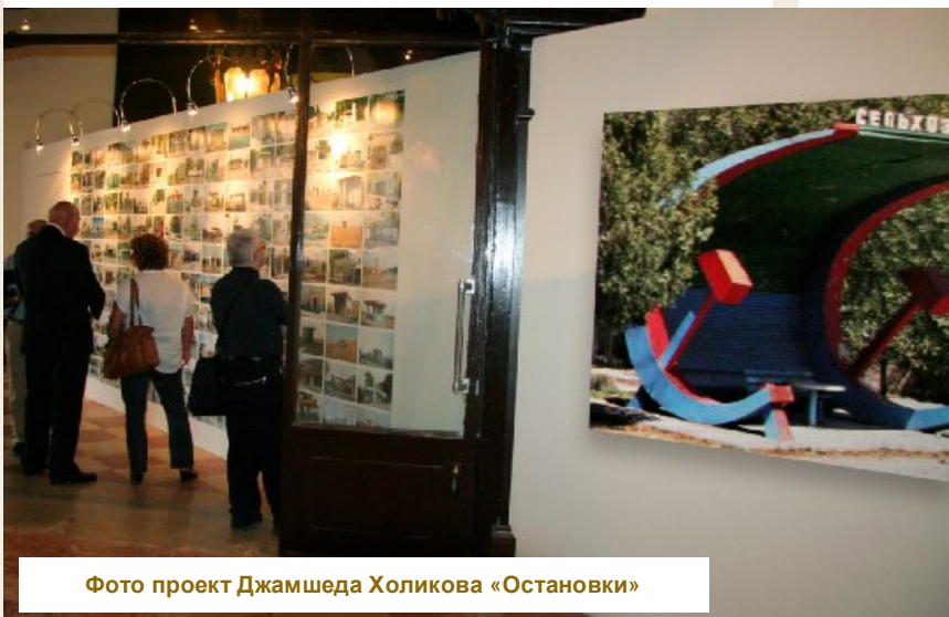
Фото проект Джамшеда Холикова «Остановки»

новременно мистический образ – лишенный идентичности и вызывающий одновременно ассоциации с распространенными клеше из «западной» и «восточной» традиций – гламурный спа-салон для ценителей всего натурального или традиционная молочная ванна восточной царицы. На выставке перформанс представлен шестью фотографиями и видео.