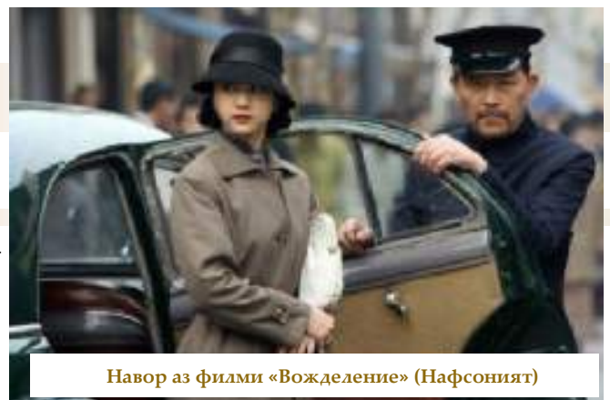
Навор аз филми «Вожделиение» (Нафсоният)

Ба назар менамояд, ки Анг Ли изҳор кардани буд, ки қувваи асосӣ, ё худ моҳияти филм – дар номаш мебошад. «Вожделиение» (Нафсоният) - ин охир ягона калимаи хоҳишро ба ҳаракат мевардагӣ, хоҳиши дигар инсонро ба худ мекашадагӣ мебошад – ва, муҳимаш дар он аст, ки ин хоҳиши эгоистӣ аст. Ва ҳамин тавр, маҳз дар эгоизми ду қаҳрамони асосӣ ҳамаи филм сохта шудааст – ва тамошо намудани ин ду шахсиятҳои бақувват, шахсиятҳои нафис ва тобовар, вақте ки онҳо дар ҳолати аз ягдигар мӯҳтоҷ шудан наздик ҳастанд – лаззати ҳаяҷоновар мебошад.