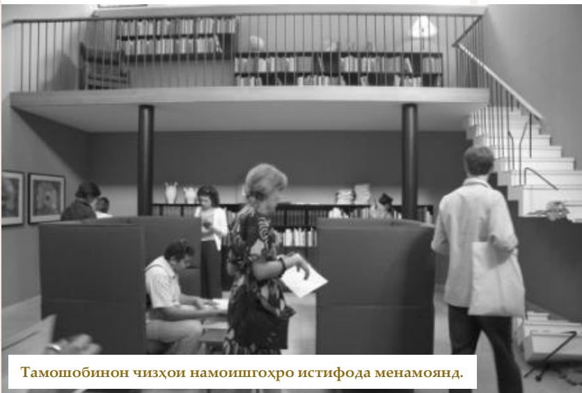
Тамошобинон чизҳои намоишгоҳро истифода менамоянд.