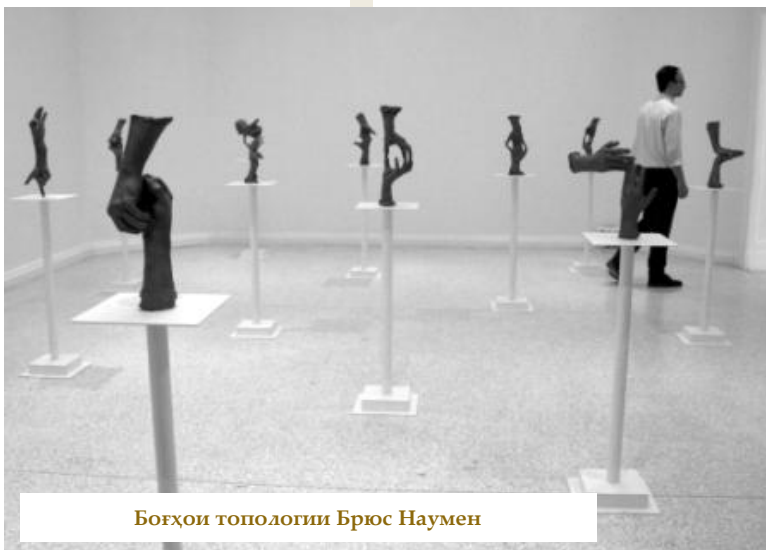
Боғҳои топологӣи Брюс Наумен

қайд кардани ҳастам, ки боз яке аз монандиҳои Биенналеи Венетсия ба бозиҳои олимпӣ - дар рақобатнокӣ он мебошад. Дар маросими кушодашавии расмӣ биеннале, ки дар он президенти Италия иштирок мекунад, ба павилон ва рассоми беҳтарин мукофотҳо - «Шерҳои тиллоӣ» дода мешавад. Инчунин ҳаёти ҳакамон метавонанд рассоми ҷавони беҳтаринро ё хали беҳтарини куратории ин ё он лоиҳаро