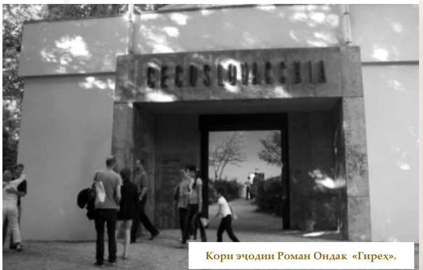
Кори эҷодии Роман Ондак «Гирех».

Дар воқеъ ин эҷоди хунар дар бисёр ҷиҳатҳо самти асосиро дар санъати муосирри визуалӣ аз нав муаррифӣ мекунад - яъне яқшавии ниҳоят бештарро бо зиндагӣ, бо ҳаррӯза.