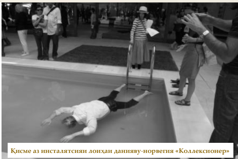
Қисме аз инсталлятсияи лоиҳаи данияву-норвегия «Коллекционер»

Шавқӣ бештарро павилонҳои русӣ ва украинӣ оварданд. Вале ин завқӣ бештар