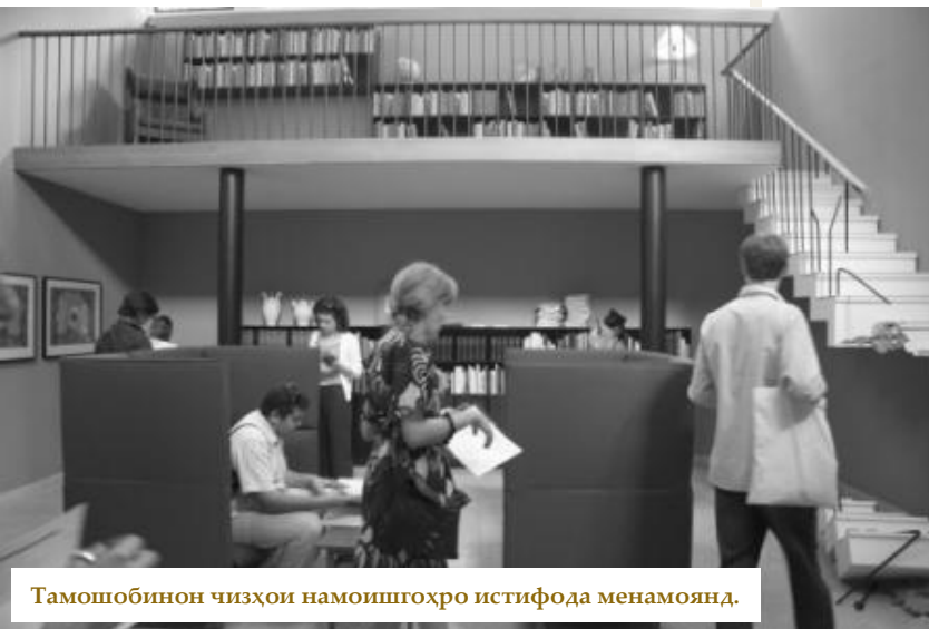
Тамошобинон чизҳои намоишгоҳро истифода менамоянд.

қабристонии аскарон, кӯчонидани муҷассамаи озодқардагони Таллин - «Аскарӣ биринҷӣ», чи тавре ки меномандаш, вобаста карда шудааст. Ҳодисаҳои моҳи май соли 2007 ҷомеаи эстонхоро ба ду гурӯҳи оштинопазир ҷудо карда буд. Ҳамчун лоиҳаи бадеӣ, мумкин ки зиёдатр аз он, ҳамчун қарорӣ граждонӣ, Кристина нусхаи аз гаҷ кардашудаи «тиллоии» «Аскарӣ биринҷиро» бо андозаи ҳақиқӣ сохта онро дар ҷое, ки муҷассама меистод, мегузорад. Дар гирди муҷассама одамон ҳамчун мешаванд - асосан аҳолии русзабони Эстония.