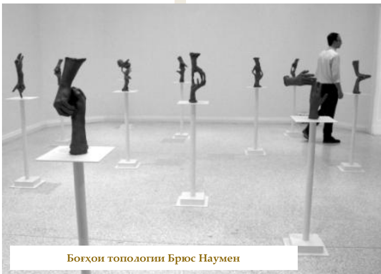
Boғҳои топологии Брюс Наумен

қайд кардани ҳастам, ки боз яке аз монандиҳои Биенналеи Венетсия ба бозиҳои олимпӣ - дар рақобатнокӣ он мебошад. Дар маросими кушодашавии расмӣ биеннале, ки дар он президенти Италия иштирок мекунад, ба павилон ва рассоми беҳтарин мукофотҳо - «Шерҳои тиллоӣ» дода мешавад. Инчунин ҳайати ҳакамон метавонанд рассоми ҷавони беҳтаринро ё ҳали беҳтарини куратории ин ё он лоиҳаро