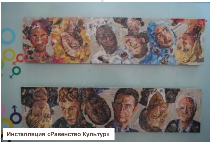
Инсталляция «Равенство Культур»

Сегодня различные культуры навязывают сообществам искусственно созданные стереотипы и модели общества, в которых лидирующие и определяющие роли всегда остаются за мужчинами. «Равенство культур» - это манифест гендерного равенства, которое должно существовать во всех сообществах, вне зависимости от религии или общего уровня развития и образования. Равноправие должно быть главным атрибутом современного общества.