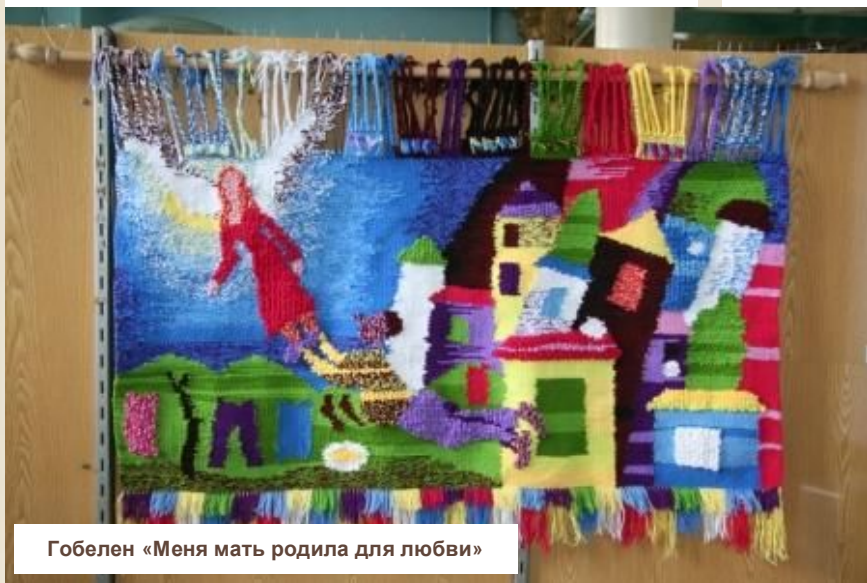
Гобелен «Меня мать родила для любви»

Это ироничное отображение образа мужчины и женщины в обозначении общественного туалета. Интересно, что как в рамках одного знака объединились текст и изображение.