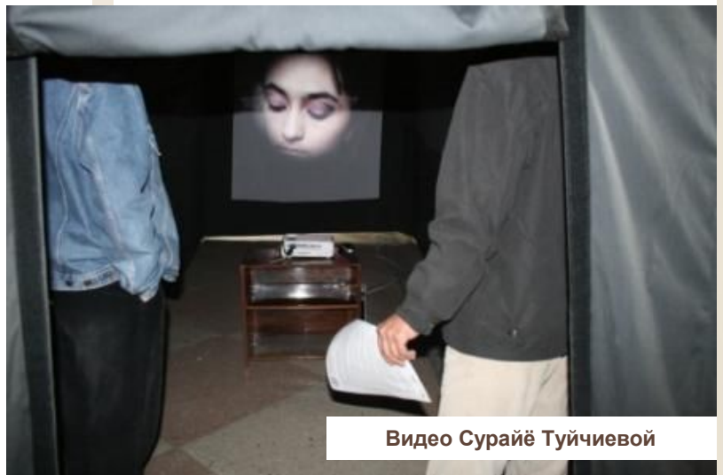
Видео Сурайё Туйчиевой

В специальном проекте «Спутник Арт Live!» работы художников воспроизводились в присутствии посетителей – любой арт-объект, выбранные из представленных на стене этого проекта, а вернее его номерная копия, была профессионально напечатана, оформлена и авторизована прямо в присутствии. Участниками проекта являлись не только художники, но и постоянно действующие