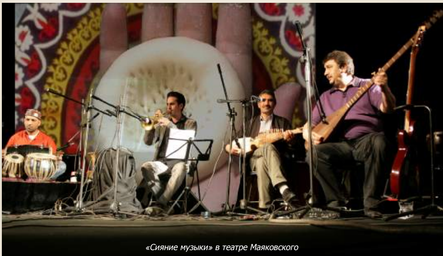
«Сияние музыки» в театре Маяковского

Не только слушатели остались под впечатлением серии концертов, проведённых при поддержке Представительства Европейской Комиссии и Посольства Франции в Республике Таджикистан в рамках «Европейской Недели» и «Дня Музыки». Сами музыканты, как французы, так и таджики, были под впечатлением музыкального богатства той программы,