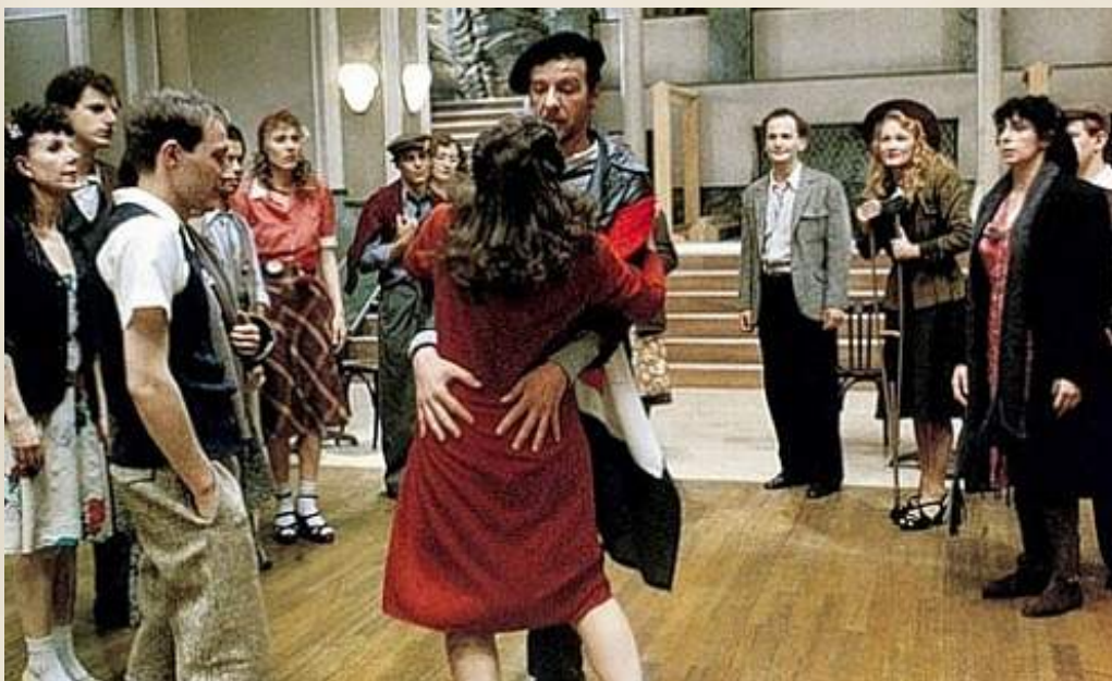
Кадр из фильма «Бал»