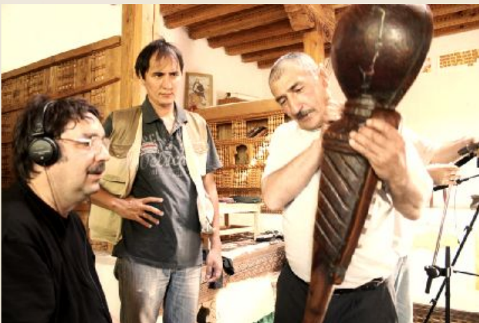
Музей «Мубораки вахони», кишлак Ямг, ГБАО