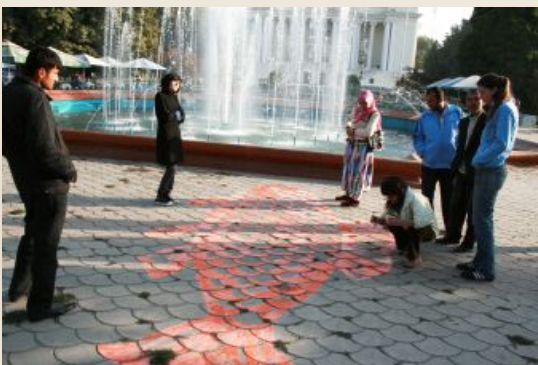
Работа Инны Кладо «Рыбка», г. Душанбе

Размышляя о судьбе современного искусства в Таджикистане, невольно приходишь к совсем неутешительной картине. Официальная культурная инфраструктура замкнутая и существующая сама для себя заняла нейтрально-негативную позицию по отношению к современному искусству. Двери выставочных залов и музеев закрыты для художников проповедующих новое искусство, отличное от того искусства которое «висит и стоит» в официальных залах. Знания о современном искусстве мелкими дозами можно получить время от времени в немногочисленных независимых институциях. Таким образом, на мой взгляд, в Таджикистане создалась идеальная среда для развития паблик арта. Не имея возможности найти свое место в культурной инфраструктуре искусство должно найти свое место в альтернативном пространстве - пространстве общественном.