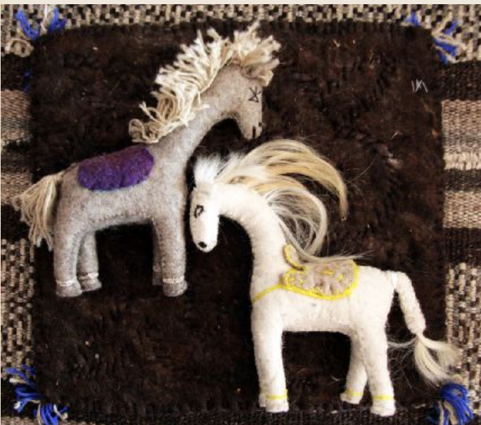
Войлочные игрушки. Кооператив "Лаёкат", г. Хороз

Вот сюзане... Сюзане – это песня, это сказка, это целая жизнь, вышитая шелком. Крутится волчком веретено старинной прялки – это песня мастерицы, переплетаясь с шелковой нитью, расцветет затем на ткани пышным садом. Здесь и розовые кусты, что извиваясь тонкими стеблями, склоняются под тяжестью пышных бутонов и солнце – символ жизни – главный элемент в вышитом ковре, от него берут начало самые прекрасные орнаменты. Каждый стежок, каждая веточка в цветке, каждая завитушка прихотливого сюжета имеет свое неповторимое значение. И еще – ряд поверий, которые придают особое очарование этому прекрасному изделию: вышивая сюзане для дочери, мать непременно оставит один цветок или часть орнамента – незаконченными, чтобы молодой мастерице было на чем поучиться вышивке, доделывая эту работу. Или, например, вы замечали, что практически всегда в сюзане среди десятка одинаковых элементов орнамента всегда найдется один-два нестандартных, не похожих на другие – или цвет другой, или форма или направление узора? Думаете, это простая ошибка мастера? Ничего подобного, все продумано до мелочей. Просто, как говорят старые мастера: «... идеально может сделать только Аллах, а человеку свойственно ошибаться...»